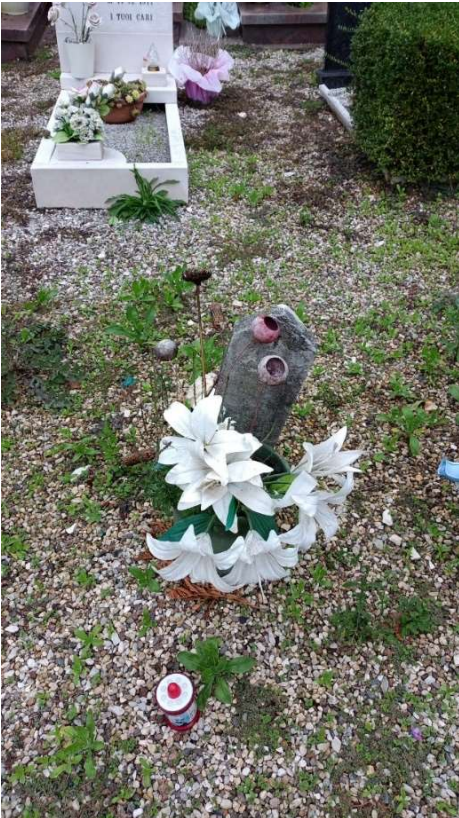
CIPPO SENZA NOME NR. 15