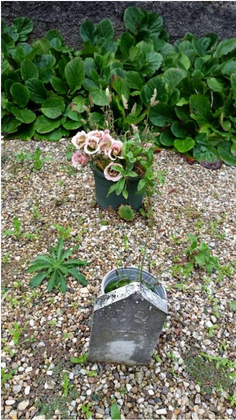
CIPPO SENZA NOME NR. 9