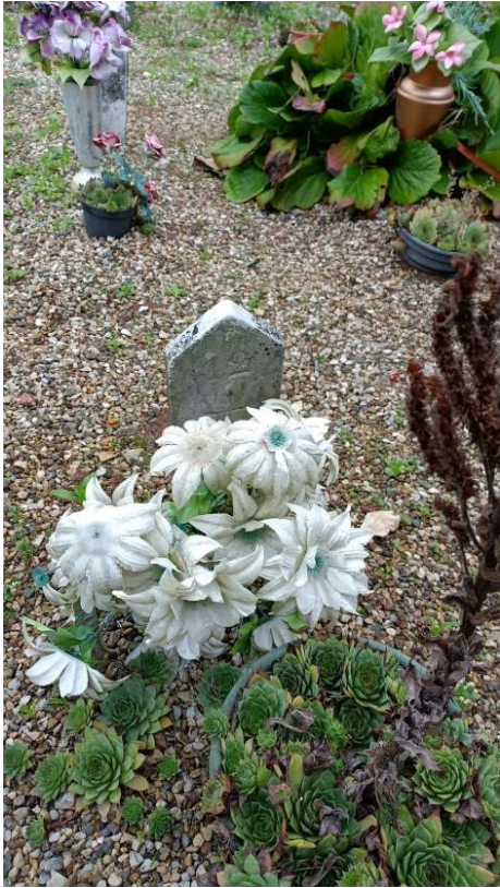
CIPPO SENZA NOME NR. 6