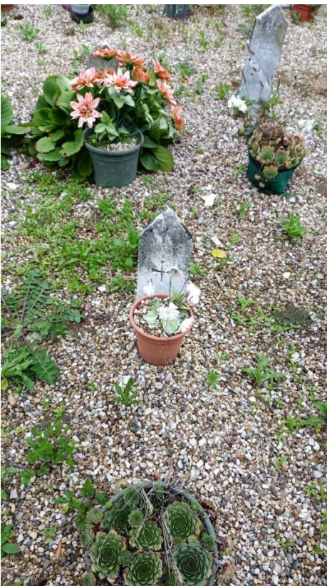
CIPPO SENZA NOME NR. 3