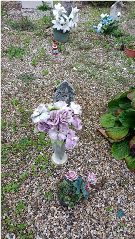
CIPPO SENZA NOME NR. 23