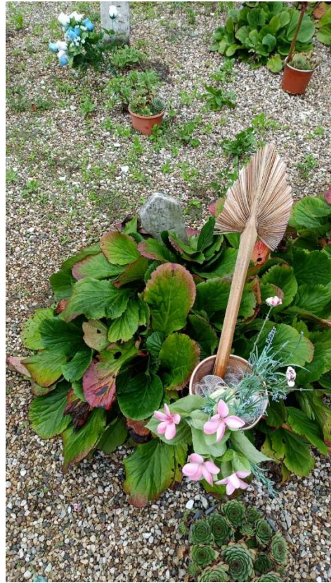
CIPPO SENZA NOME NR. 14