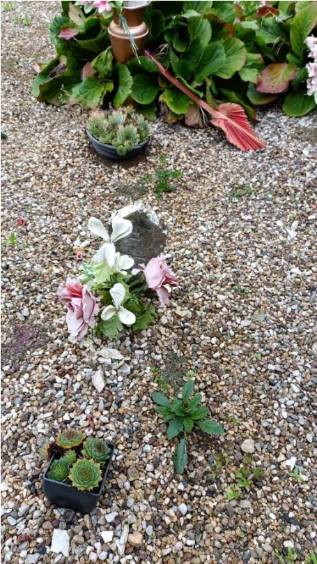
CIPPO SENZA NOME NR. 7