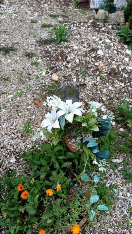
CIPPO SENZA NOME NR. 19