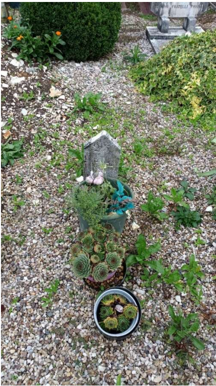
CIPPO SENZA NOME NR. 21