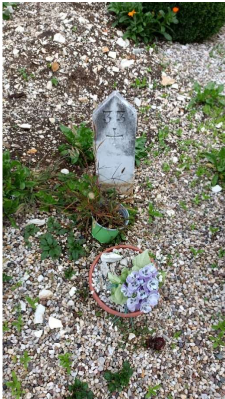
CIPPO SENZA NOME NR. 22