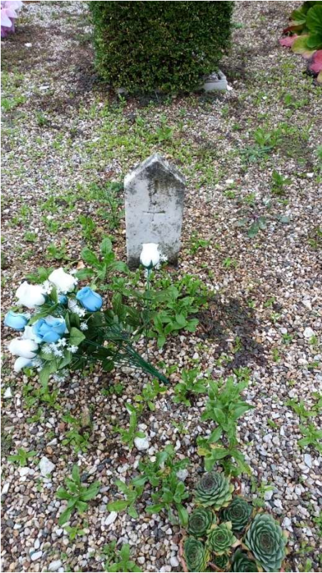
CIPPO SENZA NOME NR. 17