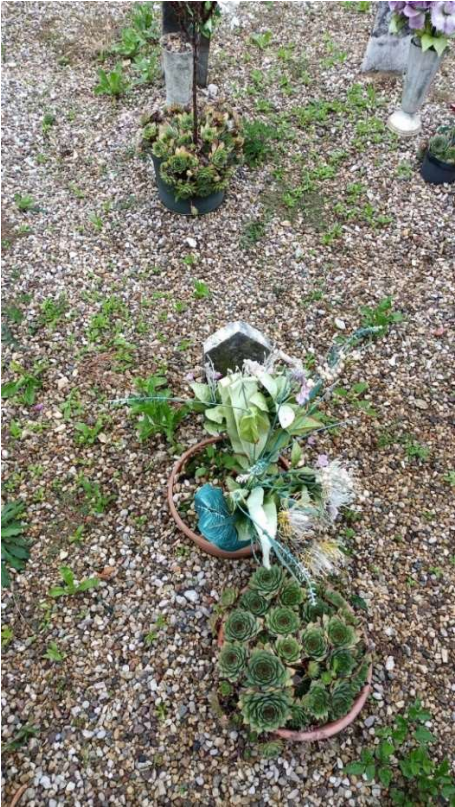
CIPPO SENZA NOME NR. 5