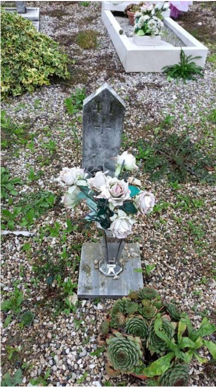
CIPPO SENZA NOME NR. 1