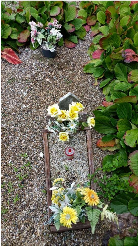
CIPPO SENZA NOME NR. 10