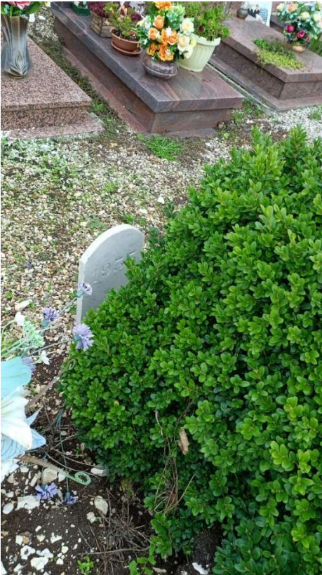
CIPPO SENZA NOME NR. 13