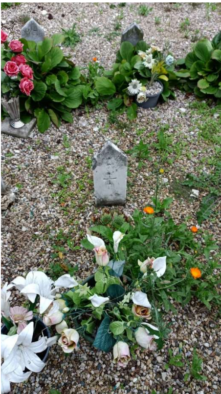
CIPPO SENZA NOME NR. 11