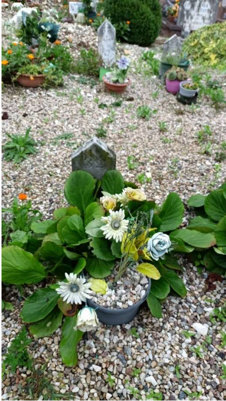
CIPPO SENZA NOME NR. 18