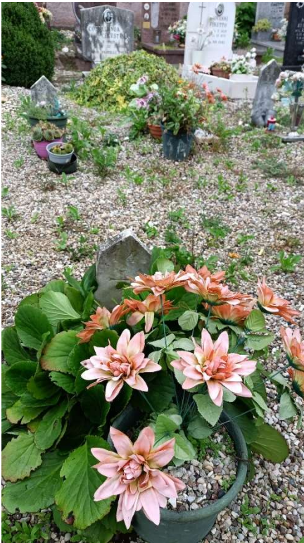
CIPPO SENZA NOME NR. 25